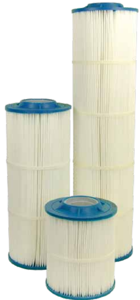
Cartucce Premium Hurricane® Harmsco-Free