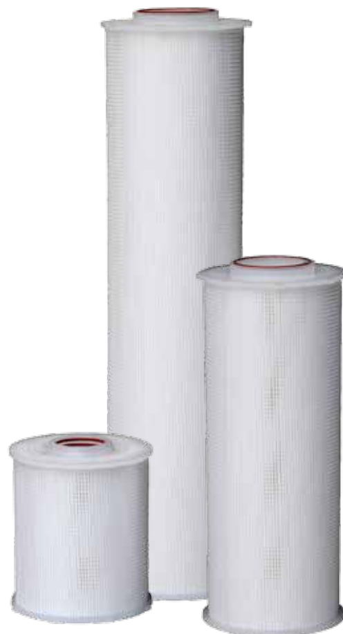
Cartucce Premium Hurricane® All-Poly